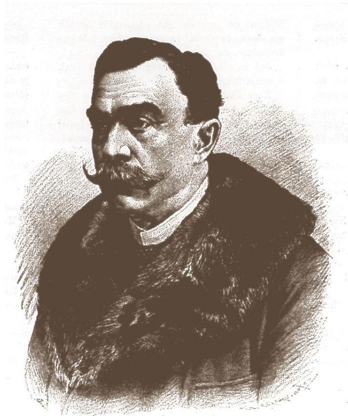
Ivan Nep. Hummel, hrv. glasbotvorac

(1850 – Kirchenmusikverein; 1858 – Esseker-Liedertafel; 1862 – Esseker Gesangs-Verein)