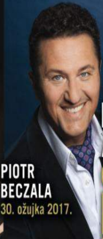
PIOTR BECZALA 30. ožujka 2017.