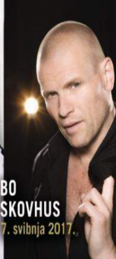
BO SKOVHUS 7. svibnja 2017.